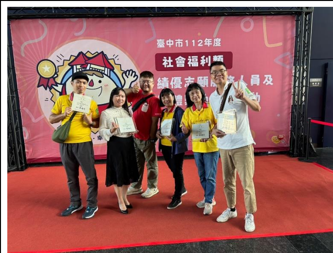
11/15(三)台中市志願服務人員頒獎