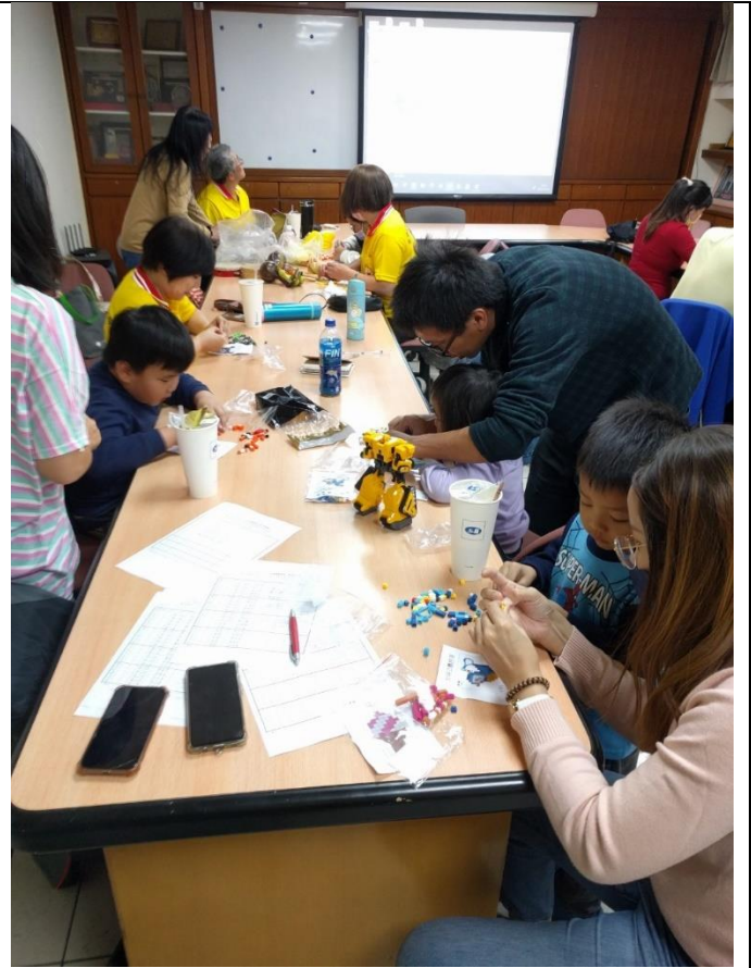
11/18(六)十一月月例會--拼豆遊戲