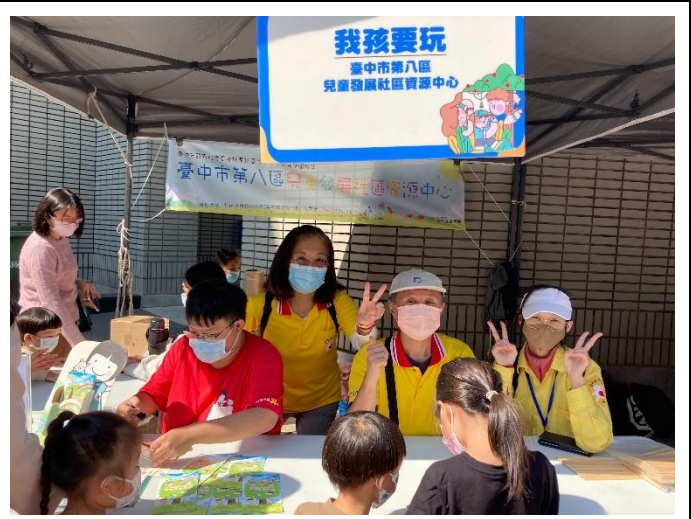
11/19(日)親子館宣導協助