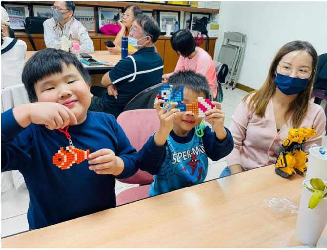
11/18(六)十一月月例會--拼豆遊戲