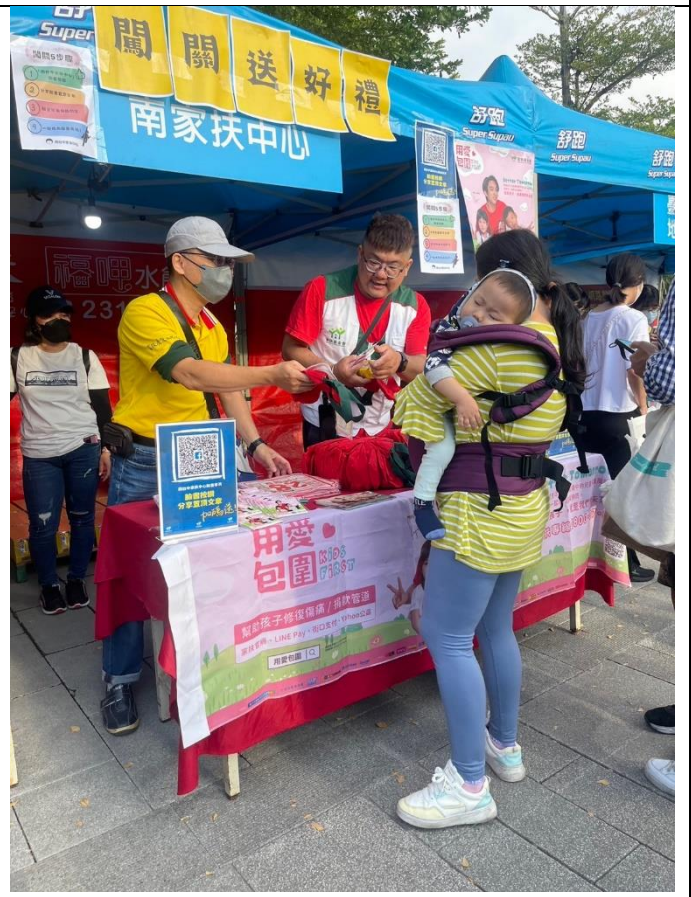
11/12 舒跑杯兒保宣導活動--認真宣導