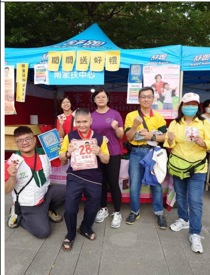
11/12(日)舒跑杯兒保宣導活動